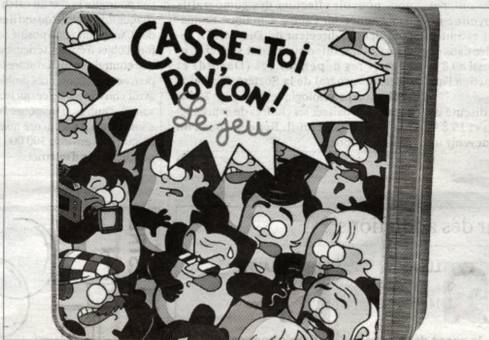
Avec cette polémique, le jeu Casse-toi pov'con ! aura bénéficié d'une belle publicité...